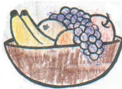
これはかみさまがボクにくれたたべもの！ いう まさき

わたしは、天国はあると思います。みんながないと思っても、わたしは天国があり、神様がいますと思っています。地ごくには行きたくないです。地ごくに行くと、ゆうれいになった体から「うじ虫」という物がでてきます。みんながわるいこと（人を殺したり）すると、神様が地上に来て地球を滅ぼすので、わたしは何だかこわいです。みんなが人を殺したりしなければ、神様は地球を滅ぼさないから、みんな人を殺したりするのは止めたほうがいいと思います。天国は楽しいところで、地獄は苦しいところです。わたしは教会でお勉強をして、いろんなことを学んだりして、聖霊をもらって、天国へ行きたいです。でも、みんなが悪いことをすると、地ごくへ行きます。地ごくに行きたくないので、わたしはなるべく教会に行きます。教会ではいろんな事を勉強します。そして、いろんなことを教えてもらえるので、わたしは教会が大好きです。分からないことはちゃんと答えてくれるので、うれしいです。わたしは教会で聖霊がもらえるようにがんばります。